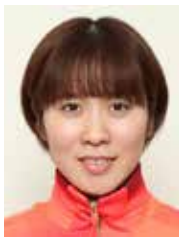
平野 美宇 (ひらの みう) 女 HIRANO Miu/F