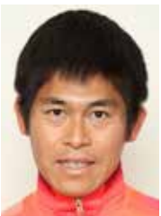
川内 優輝 (かわうち ゆうき) 男 KAWAUCHI Yuki/M