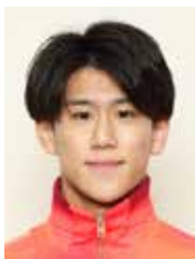
橋本 大輝 (はしもと だいき) 男 HASHIMOTO Daiki/M