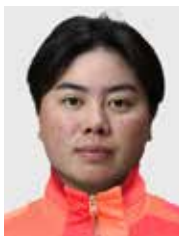
笹生 優花 (さそう ゆうか) 女 SASO Yuka/F