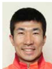
桐生 祥秀 (きりゅう よしひで) 男 KIRYU Yoshihide/M