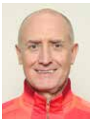
監督 トム ホーバス (とむ ほーばす) 男 HOVASSE Tom/M