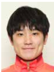
張本 智和 (はりもとともかず) 男 HARIMOTO Tomokazu/M