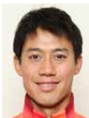
錦織 圭 (にしこり けい) 男 NISHIKORI Kei/M