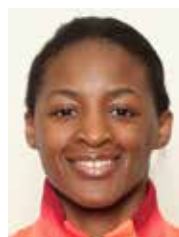
馬瓜 ステファニー (まうり すてふぁにー) 女 MAWULI Stephanie/F