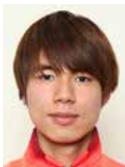
堀米 雄斗 (ほりごめ ゆうと) 男 HORIGOME Yuto/M