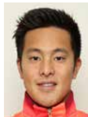
瀬戸 大也 (せと だいや) 男 SETO Daiya/M