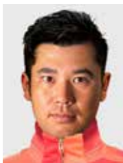
松山 英樹 (まつやま ひでき) 男 MATSUYAMA Hideki/M