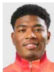
八村 塁 (はちむら るい) 男 HACHIMURA Rui/M