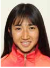
田中 希実 (たなかのぞみ) 女