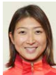
池江 璃花子 (いけ えりかこ) 女