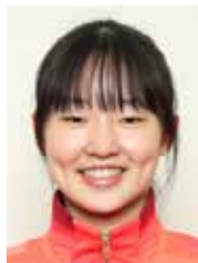
張本 美和 (はりもとみわ) 女 HARIMOTO Miwa/F