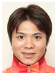
阿部 一二三 (あべ ひふみ) 男 ABE Hifumi/M