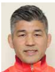
副団長 井上 康生 (いのうえ こうせい) 男 INOUE Kosei/M ③公益財団法人日本オリンピック委員会 ⑦選手強化事業専門部会員