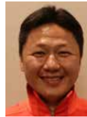
監督 大岩 剛 (おおいわ ぎょう) 男 OIWA Go/M