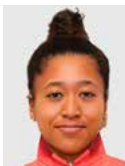
大坂 なおみ (おおさか なおみ) 女 OSAKA Naomi/F