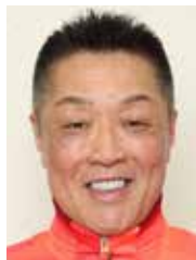
監督 眞鍋 政義 (まなべ まさよし) 男 MANABE Masayoshi/M